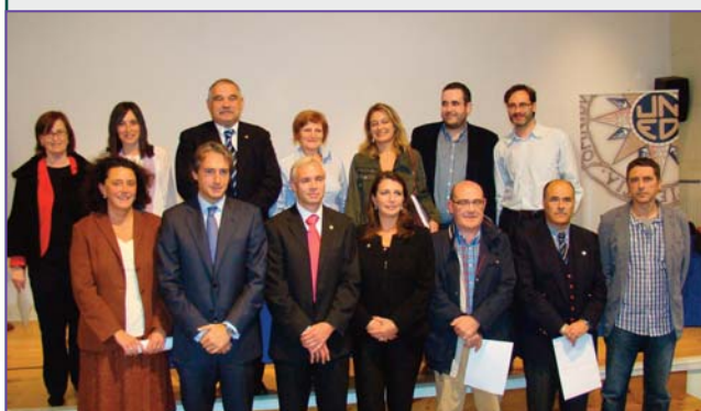
Autoridades y algunos de los Tutores que recibieron la Venia Docendi de la UNED.