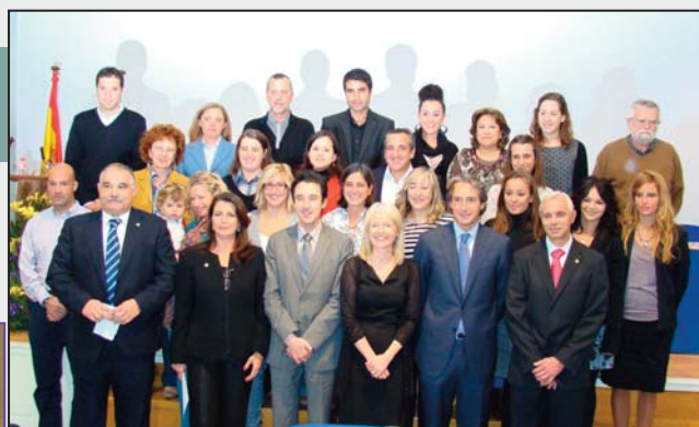
Autoridades y egresados que asistieron al Acto de Apertura del curso 2011-12.

Cerró el acto y dio por inaugurado oficialmente el curso académico 2011/2012 en el Centro Asociado de la UNED de Cantabria la Vicerrectora de Ordenación Académica que además hizo un especial agradecimiento a los asistentes por compartir la celebración de un acto como es la inauguración de curso con el Centro, además, este cobra especial importancia porque la UNED celebrará su 40 aniversario.