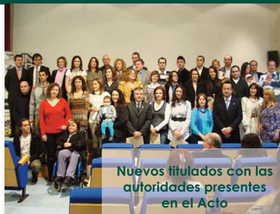
Nuevos titulados con las autoridades presentes en el Acto