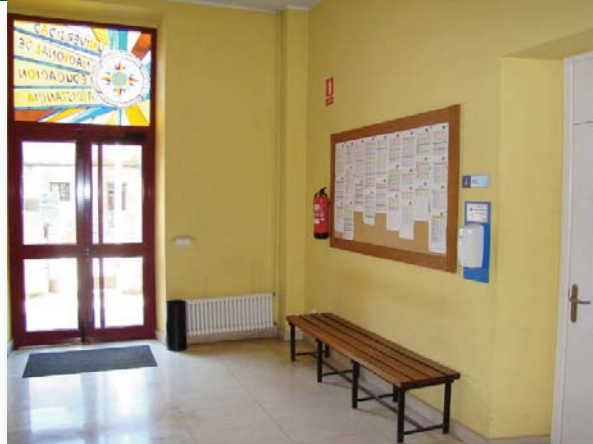
Vestíbulo de entrada de la sede de la UNED en Cantabria, en la calle Alta (ala oeste del C.P. Ramón Pelayo)

Las instalaciones cuentan rampa de acceso entrando por el lateral izquierdo, ascensor (frente a las máquina de refrescos), Servicios WC en Planta Baja y Primera Planta; en ésta última, junto a los de Señoras hay Servicios para minusválidos.