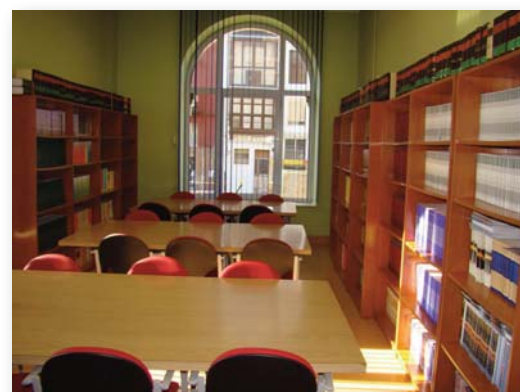
Sala de Estudio del Centro, situada en la Planta Baja del edificio.

Si estáis interesados sólo tenéis que presentar el carnet u otro documento que acredite ser alumno de la UNED o de la UC en el mostrador de cualquiera de sus bibliotecas.