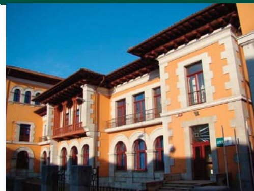
Fachada principal de la sede del Centro Asociado de la UNED en Cantabria, en Santander -cerca de Cuatro Caminos-, que este curso cumple 30 años.

En estas Jornadas, se presentan a los futuros estudiantes los recursos con los que contarán siendo alumnos de la institución académica (tutorías, biblioteca, laboratorios, salas de informática). También se podrá solicitar información sobre la oferta académica y la metodología de la Universidad a Distancia.