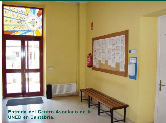
Entrada del Centro Asociado de la UNED en Cantabria.

Los Técnicos Superiores de FP tendrán acceso a cualquier Grado de la UNED , independientemente de su rama o especialidad.