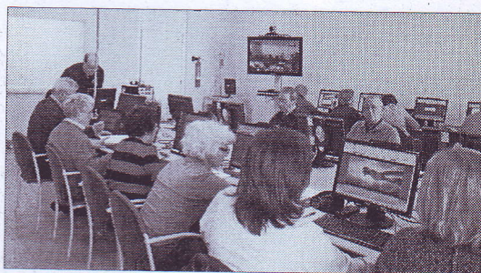
Participantes en un curso de la UNED.

en las áreas de salud, idiomas e informática. Según informó la UNED en un comunicado, entre las ventajas de este programa destaca su metodología, al combinar las clases presenciales con el apoyo de su plataforma virtual, lo que «propicia el uso de las TICs y una mayor flexibilidad al alumno». Los alumnos Senior dispondrán de Guías Didácticas y diversos recursos audiovisuales de cada una de sus asignaturas para