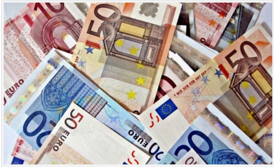
Cantabria reduce su presupuesto de Educación

Anuncios Google Educativo Gasto Publico Becas Gobierno