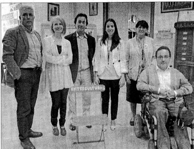
Presentación de la 'silla roja' en el colegio Ramón Pelayo de Santander.