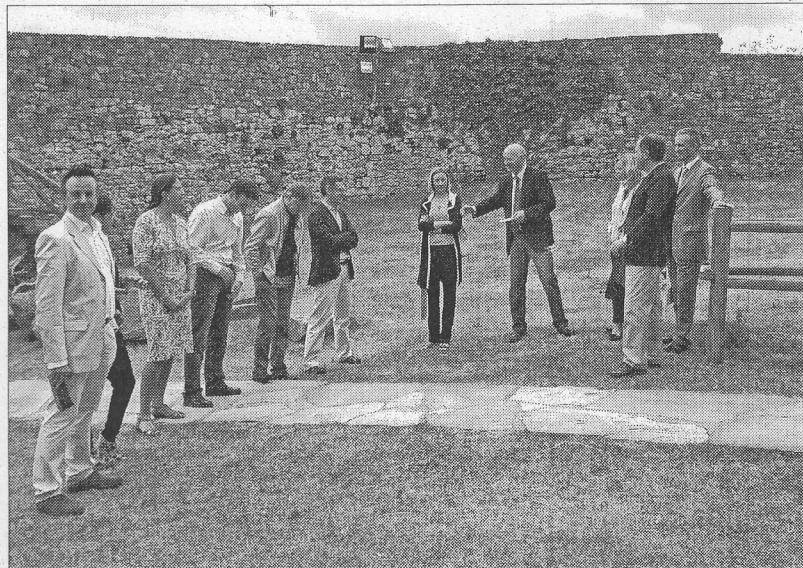
Un momento de la inauguración de la muestra fotográfica 'Espacio y Territorio'.