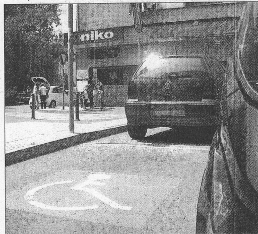
En Torrelavega existen 655 de estas tarjetas de aparcamiento.