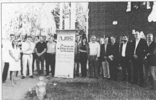
La nueva sede, de ámbito regional, está en Barreda.

La rescisión de los contratos a partir del 30 de junio les fue comunicada a las dos trabajadoras la pasada semana, «una maniobra» que, para el edil socialista, va a costar a las arcas municipales cerca de 100.000 euros.