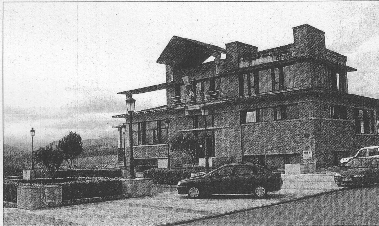
El Ayuntamiento continúa siendo uno de los más pagadores. /EM