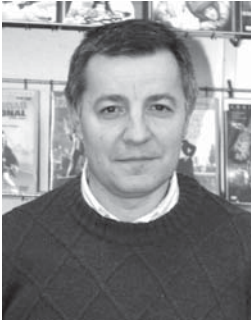
Por Javier Collantes