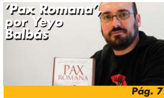
'Pax Romana' por Yeyo Balbás