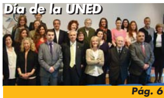
Día de la UNED