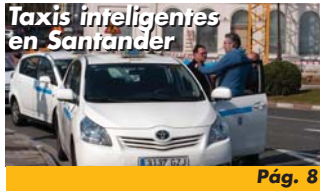
Taxis inteligentes en Santander