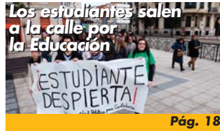
Los estudiantes salen a la calle por la Educación