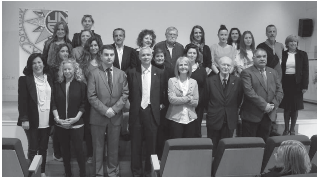
FOTO DE FAMILIA DE LOS EGRESADOS DE LA UNED JUNTO A LAS AUTORIDADES

En su discurso, González hizo una mención especial a la celebración del 40 aniversario de la Universidad Nacional de Educación a Distancia (UNED) a nivel nacional ya que la institución académica "ha logrado en todos estos años proporcionar una formación superior a decenas de miles de personas a través de un modelo educativo donde se combinan presencia y virtualidad mediante la utilización de las tecnologías de la imagen y de la comunicación siendo pionera en este campo". En el caso de Cantabria, precisó el director, "el arraigo del centro tiene un largo recorrido de más de 30 años, durante los cuales,