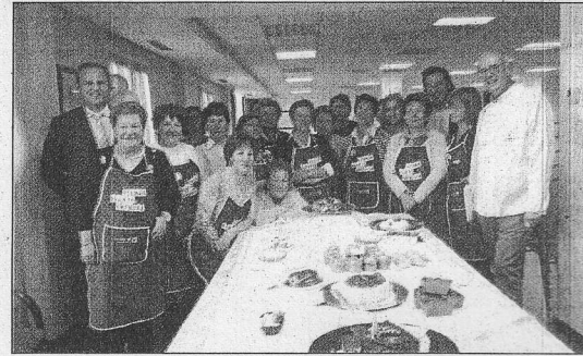
Clausura de un curso de cocina.