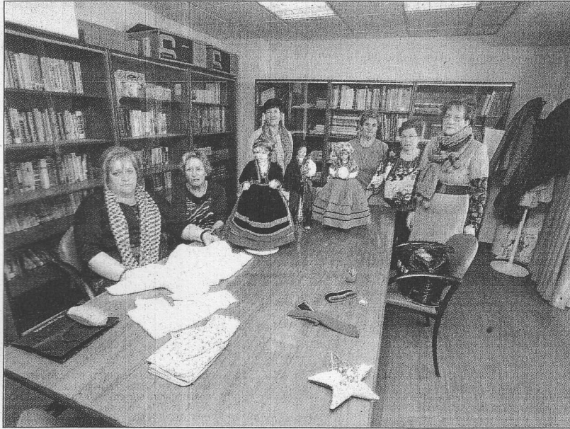
Este grupo de mujeres trabaja en la confección de trajes tradicionales.