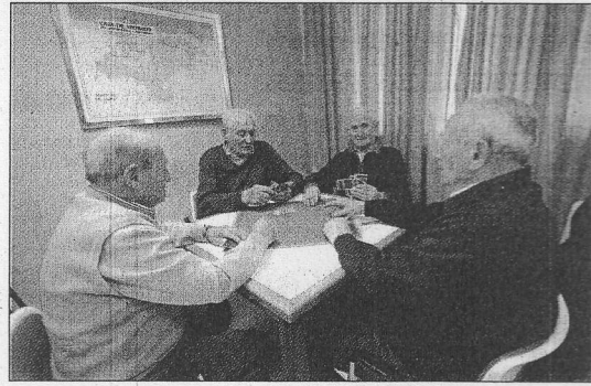
Animada partida a las cartas.

Ocurre también que el centro se convierte en local espontáneo de otras actividades. Es el caso de