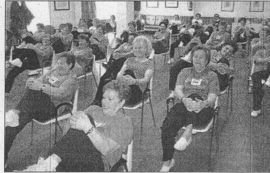
Un grupo de mujeres, en clase de pilates.